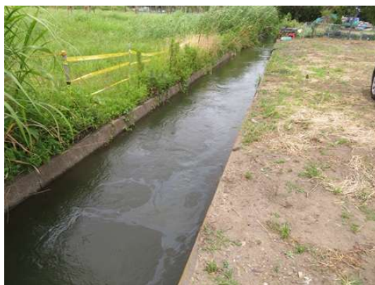
油流出による油膜の様子

場合によっては、水稻の生育に重大な影響を及ぼす可能性がありますので、水質汚濁を見つけたら、行政や土地改良区へ、ご連絡をお願いいたします。