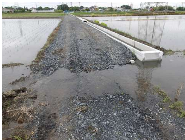
水田から水が溢れている様子

水路巡視をしていますと、所々で過剰取水や無効放流がみられます。下流側の利水者が取水できませんよう、分水栓や堰板の適切な管理をお願いいたします。